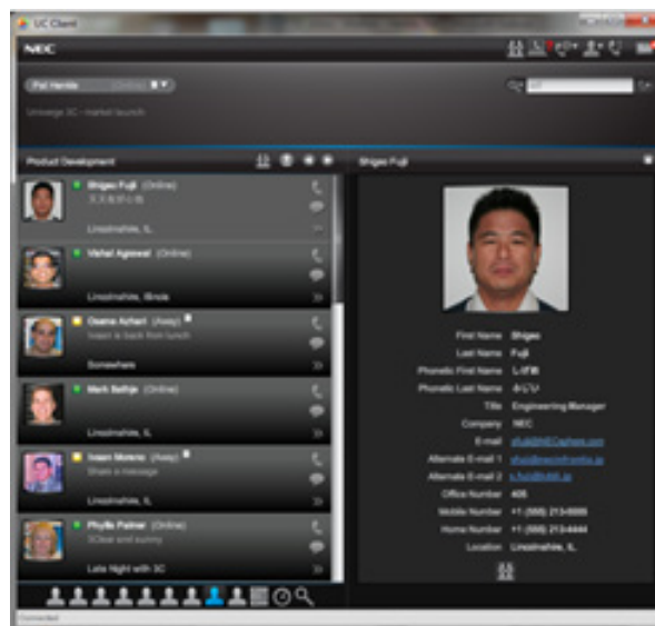
UC Client fournit des informations de contact détaillées